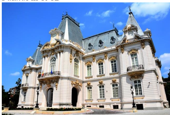
Palatul în 2014