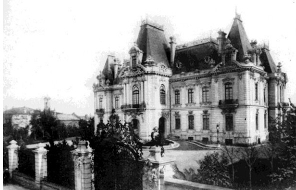
Palatul în 1912

În arhive, a fost descoperită o fotografie tip ”vedere” din anul 1903, în care Palatul Mihail, aflat în construcție avea unele ornamente, care nu s-au păstrat în 1912, când există alte ”vederi” cu Palatul Mihail finalizat. Acele ornamente erau de tipul ”vase ale abundenței” și fuseseră plasate, inițial, în anumite colțuri ale construcției.